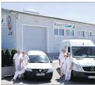
Die Firma Maler Roos in Schorndorf-Schlichten.

Vor der weiteren Zukunftsplanung steht nun aber erstmal das große Fest vom 16. bis zum 18. August (siehe Karten rechts oben) in Schorndorf-Schlichten. Drei Kapellen spielen in diesem Zeitraum live in eigens errichteten Pseitzelt. Es gibt ein Kinderkarussell, eine Schießbude und einen Süßwarenstand. Obendrein gibt's eine Fahrzeugausstellung der Oldtimerfreunde von der Schorndorfer Feuerwehr sowie eine Traktorenschau.